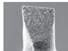
刀刃形状 Cutting edge shape

单位【规格：mm/价格：日元】 Unit [Size : mm / Retail Price : JPY]