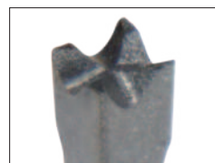
刀刃形状 Cutting edge shape